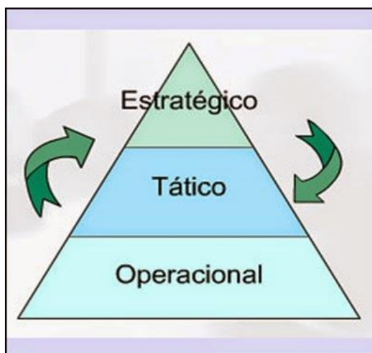
Fig. 02 – Dinâmica entre os diferentes níveis de planejamento

extrema”, por meio da implementação de instrumentos apropriados que remetem ao desenvolvimento socioeconômico das regiões mais pobres do País, em especial a semiárida. Para que esta atuação seja eficaz, eficiente e efetiva, há necessidade de modernizar a Empresa com instrumentos, técnicas e ferramentas de gestão e governança, que tornem efetivos os resultados dos processos de trabalho. Diante disso, a Codevasf apresenta o seu Plano Anual de Negócios (PAN) para o exercício de 2017.