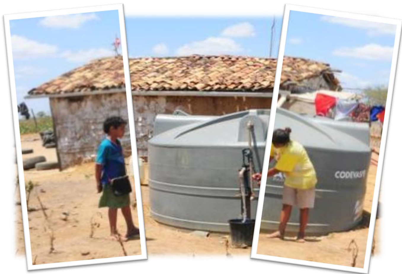
Atuação da Codevasf no semiárido Alagoas-AL