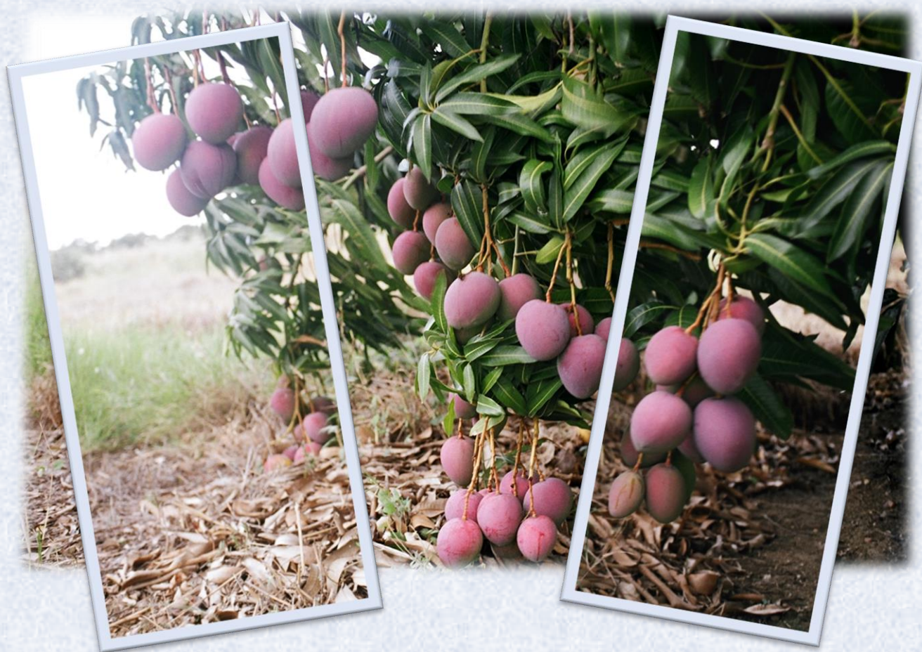
Projeto de irrigação no semiárido – Fruta o ano inteiro