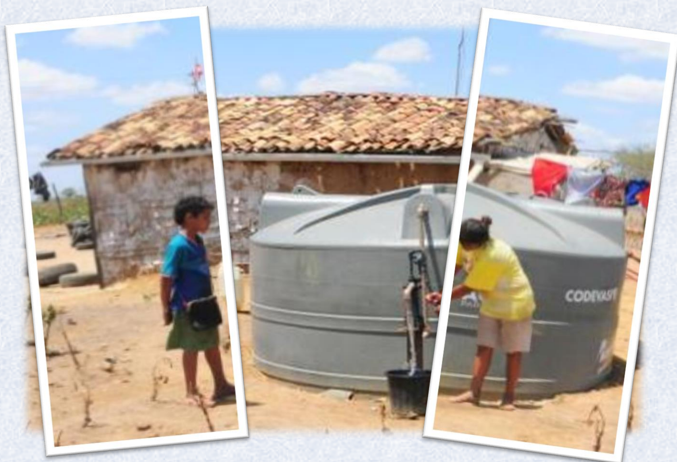
Atuação da Codevasf no semiárido Alagoas-AL