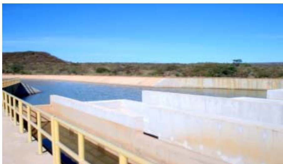
Baixio de Irecê: projeto total prevê atender 59.375 hectares irrigáveis

A construção civil das obras de infra-estrutura de uso comum da primeira etapa ficará a cargo da Emsa.