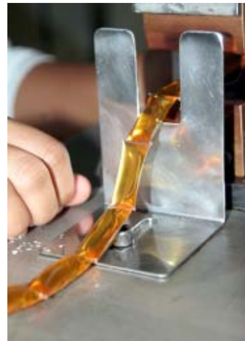
De 1999 a 2005, a produção de mel do Piauí cresceu 183%

Além do Piauí, o apoio da Codevasf na estruturação da atividade apícola nas ações de mobilização e capacitação beneficiaram aproximadamente 2,2 mil produtores na região Norte de Minas e microrregiões de Ibotirama e Bom Jesus da Lapa, na Bahia, Moxotó, Araripe, Pajeú e São Francisco, em Pernambuco e Juazeiro, também na Bahia. Nessas regiões, a Codevasf investiu, entre 2004 e 2007, R$ 6,5 milhões, incluindo também os territórios das regiões do Baixo São Francisco, em Alagoas e Sergipe.