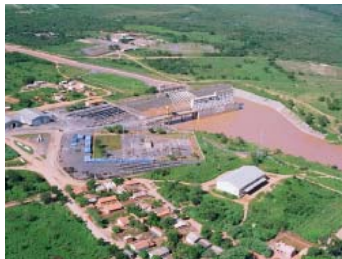
Projeto Jaiba gera 181 mil empregos diretos e indiretos

Os números do projeto totalmente concluído demonstram sua grandeza: em uma área bruta de mais de 157 mil ha, com área líquida irrigada de 66 mil ha, a produção de alimentos é de 2,3 milhões de toneladas/ano, atingindo a marca de R$ 522 milhões/ano. A geração de emprego (direto e indireto) é da ordem de 181 mil. Estima-se que o investimento para implantar uma lavoura na região é de cerca de R$ 15,5 mil/ha. A infra-estrutura garante a produtividade: 530km de canais de irrigação, estação de bombeamento com capacidade de 80m 3 /seg, 660 km de estradas de circulação dentro do perímetro. O local também se destaca como o projeto de irrigação com a maior área de preservação ambiental: 90.078 ha. Em novembro de 2007, a Codevasf assinou as escrituras públicas de compra e venda de 122 lotes agrícolas, localizados na gleba C-2, do Jaiba, totalizando a alienação de 2.907,16 ha, que somados às alienações resultantes dos editais anteriores totalizam 8.642,17 ha vendidos. Os empresários licitantes vencedores atuam nos setores agropecuário e agroindustrial.