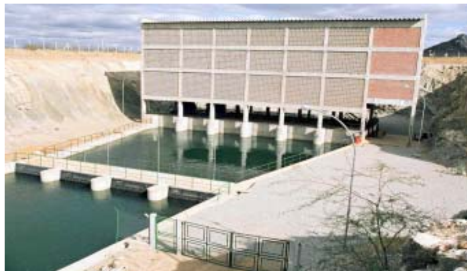
Salitre: com a conclusão da primeira etapa será liberada uma área irrigável de 5.084 hectares

Com a conclusão da primeira etapa, também prevista para julho de 2009, será liberada uma área irrigável