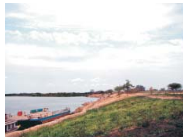
Campo de Provas na Bahia testará engenharia que será utilizada na revitalização

Já foram construídos o primeiro trecho experimental e a estrutura de compostagem. Também está sendo feita a plantação de espécies nativas e foram instalados viveiros de mudas. Essa inici-