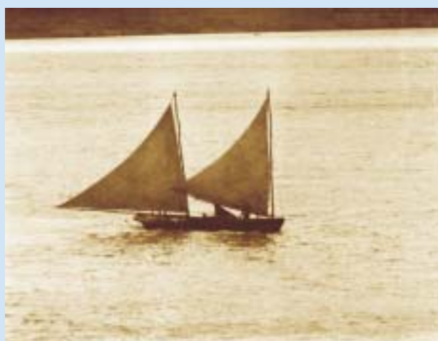
Imaginário popular criou diferentes versões para a origem do rio

Assim como a lenda de sua origem, o Velho Chico é fonte de inspiração para o surgimento de outras crenças e mitos. No imaginário popular, lá habitam figuras como “o nego d’água”, um ser