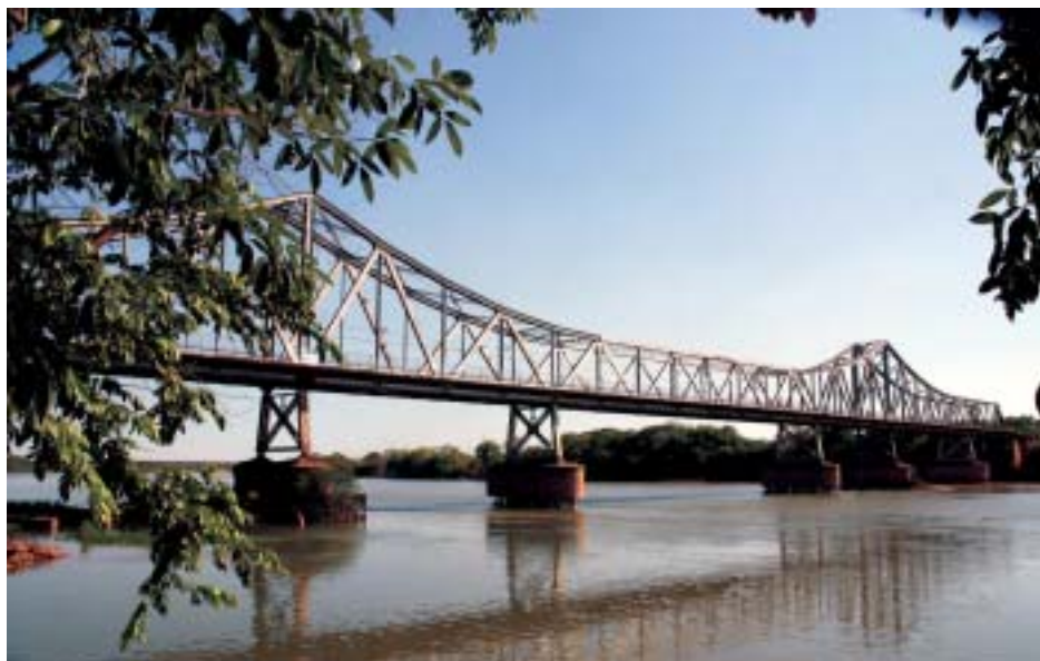
Recuperação do rio inclui ações na cidade de Teresina

A Reserva da Floresta Nacional dos Palmares, localizada em Altos, no Piauí, receberá recursos da Codevasf para a implantação de um Centro de Referência em produção de mudas. A iniciativa será viabilizada pelo governo do estado do Piauí, por intermédio da Secretaria de Meio Ambiente e Recursos Hídricos (Semar), o Instituto Brasileiro do Meio Ambiente e dos Recursos Naturais Renováveis (Ibama) e o Piauí Flora. O objetivo do empreendimento, que custará R$ 1,5 milhão, é produzir mudas de espécies nativas para a revitalização de áreas de preservação,