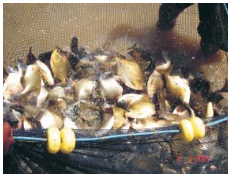
Perímetros irrigados podem ser explorados para desenvolvimento da piscicultura

de um pequeno lote com 4,3 hectares de área irrigada, foram colocados 780 tambaquis com peso médio de 19 gramas. Após 240 dias de cultivo, a produtividade alcançada foi de 12.548 kg/ha com os peixes atingindo o peso médio de 1 kg. A estratégia de cultivo oferece aos peixes ração balanceada de boa qualidade e promove renovação diária da água do reservatório na quantidade de 13% do volume/dia. Essa água de renovação é destinada à fruticultura.