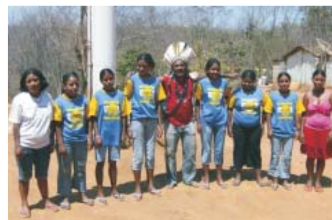
Aldeia irá desenvolver atividade apícola

para os jovens. Eles relatam que a maioria, principalmente na época do corte da cana-de-açúcar e da colheita do café, desloca-se para outras localidades em busca de trabalho e melhores condições de vida. Mas, segundo as lideranças, a ida desses jovens para centros urbanos tem aspectos negativos, pois normalmente eles retornam para suas aldeias com costumes e hábitos diferentes dos praticados pela comunidade.