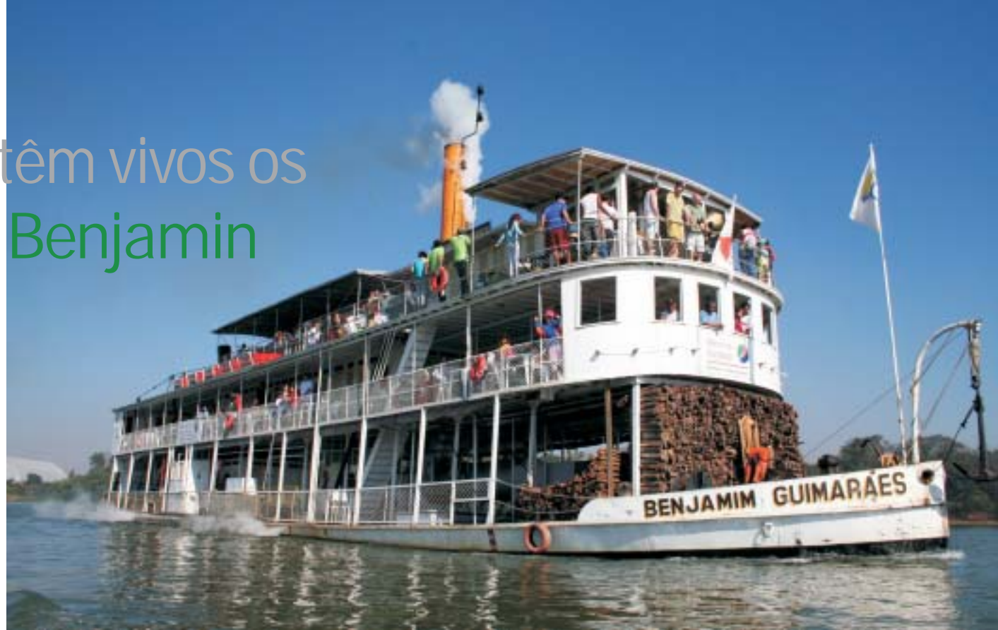
Embarcação preserva características originais