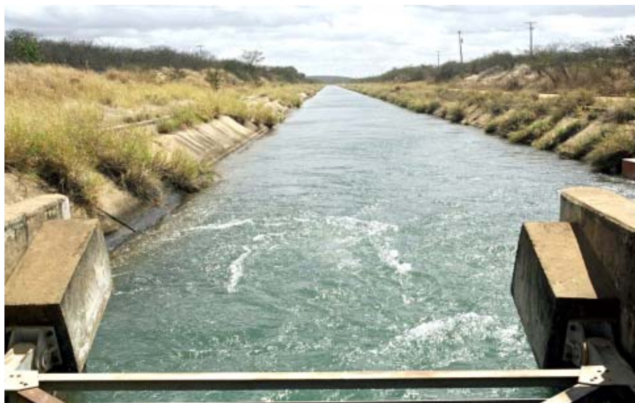
Investimento em agricultura irrigada contribui para melhoria da qualidade de vida

No setor industrial, desenvolveram-se indústrias de processamento de tomates e de frutas para sucos, produção de vinho, açúcar, álcool, equipamentos de irrigação e insumos agropecuários; no setor agrícola, vários empreendimentos modernos voltados para a produção de frutas, com destaque para uva, banana, manga, melancia e melão. No setor de serviços, o número e o tamanho dos estabelecimentos instalados na região têm apresentado altas taxas de crescimento e dinamizado os serviços bancários e de telecomunicações. O sucesso da agricultura irrigada