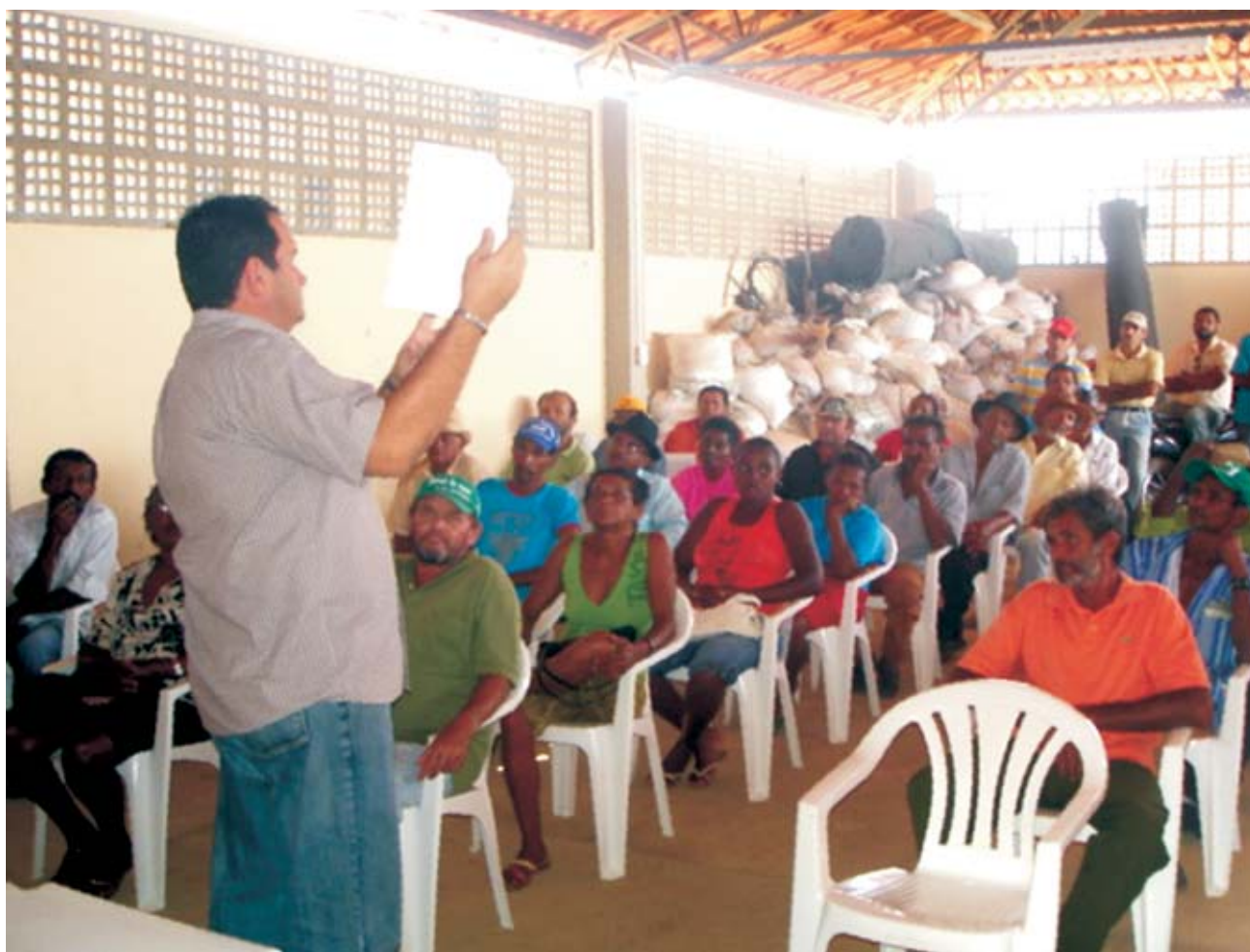
Produtores do Sistema Itaparica são orientados a respeito da negociação de dívidas com os bancos

Para estimular e intensificar o relacionamento entre produtores e agentes financeiros, a Codevasf percebeu a necessidade de ajudar nas negociações de dívidas. A inadimplência prejudica a continuidade de apoio financeiro para as atividades agropecuárias. A preocupação com o assunto surgiu a partir de discussões realizadas pelo Instituto de Assessoria para o Desenvolvimento Humano (IADH) com reassentados dos perímetros irrigados de Brígida e Glória, na Bahia.