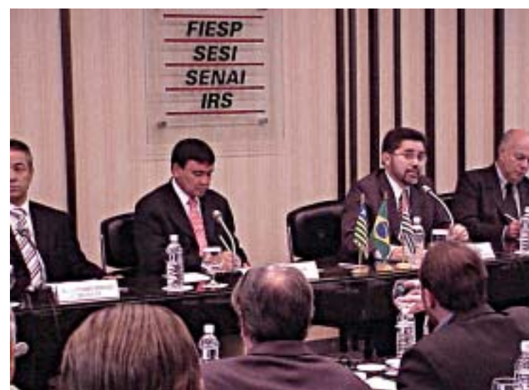
Presidente da Codevasf fala sobre o programa